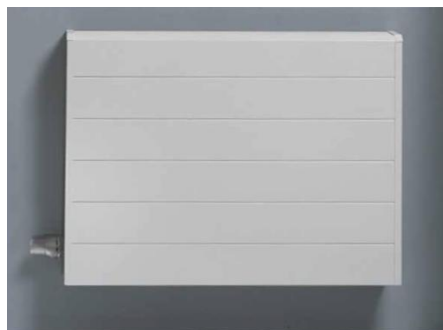
Lage temperatuur radiator

De verwarmingselementen in de verblijfsruimten 1 ste verdieping worden uitgevoerd als lage temperatuur radiatoren en zijn fabrieksmatig afgelakt. De plaatsen zullen t.z.t. door de installateur van het uitvoerend bouwbedrijf definitief bepaald worden op basis van een capaciteitsberekening. De hoofdbadkamer wordt verwarmd door een E-designradiator, voorzien van ronde buizen in de kleur wit.