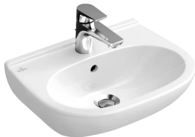
Villeroy & Boch wastafel