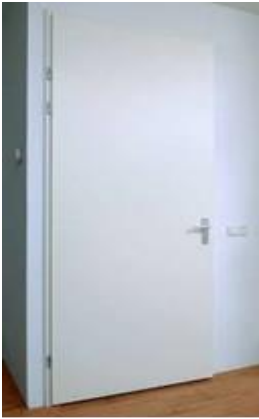
Hardhouten binnendeurkozijn zonder bovenlicht met opdekteur