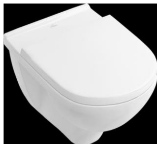
Villeroy & Boch wandtoilet