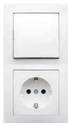
Schakelmateriaal en wandcontactdozen e.d. type Peha Badora, kleur wit

In het zicht komende elektraleidingen en opbouw montage komen voor op zolder, in de ongeïsoleerde buitenberging en eventueel bij geïsoleerde HSB wanden (i.v.m. dampdichte laag).