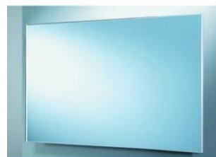
Spiegel 80 x 60