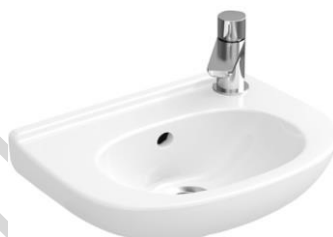
Villeroy & Boch fontein