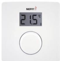
Kamerthermostaat Nefit ModuLine 1000H

De temperatuurregeling vindt plaats in de woonkamer door middel van een kamerthermostaat behorend bij de lucht-water warmtepomp. Optioneel kan er gekozen worden voor een temperatuurregeling per verblijfsruimte/vertrek.