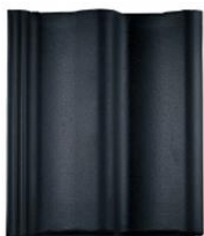
Betonnen dakpan, type sneldek

De hellende daken worden, voor zover niet anders aangegeven, gedekt met beton sneldekkpannen, inclusief de benodigde hulpstukken en de vereiste verankering.