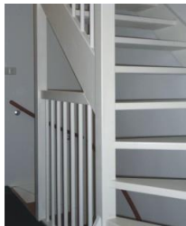
Houten open trap

Trappen uit te voeren volgens Bouwbesluit. De verdiepingstrap uit te voeren als een open hardhouten trap. Wanneer er een kast of toilet onder de trap is gelegen dan wordt de trap ter plaatse hiervan dichtgezet met stootborden.